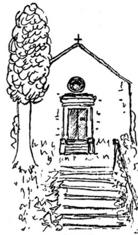
La Chapelle Notre Dame TRONCHAY de Bellevue

« J'ai à être Marie et à enfanter Dieu »