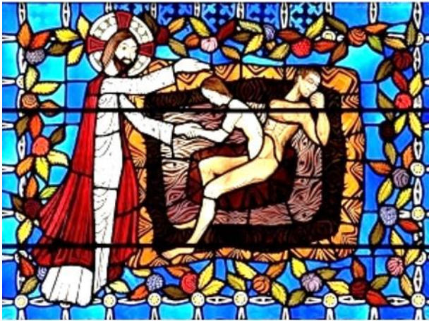
La Création – Vitrail de la cathédrale Notre-Dame de Clermont

Les chrétiens disent et proclament avec toute l'Église, que Dieu est créateur et que l'homme est sa créature la plus aboutie : 27 Dieu créa l'homme à son image, à l'image de Dieu il le créa, il les créa homme et femme. 28 Dieu les bénit et leur dit : « Soyez féconds et multipliez-vous, remplissez la terre et soumettez-la. Soyez les maîtres des poissons de la mer, des oiseaux du ciel, et de tous les animaux qui vont et viennent sur la terre. »