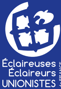
Illustration: Mathieu, Muriel