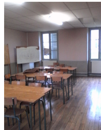
une des salles paroissiales