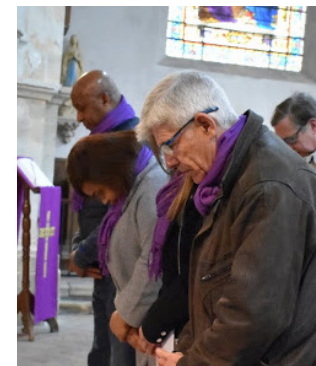
Scrutins: prière silencieuse

Pour la réponse, rendez-vous le 1 er février 2020.