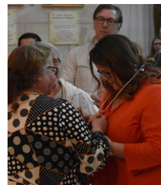
Entrée en catéchuménat: remise de la Croix