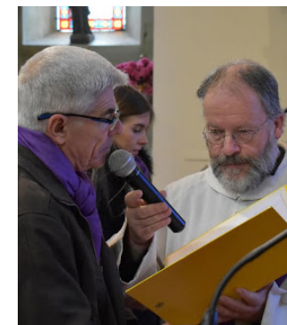
Scrutins: lecture de la prière litanique