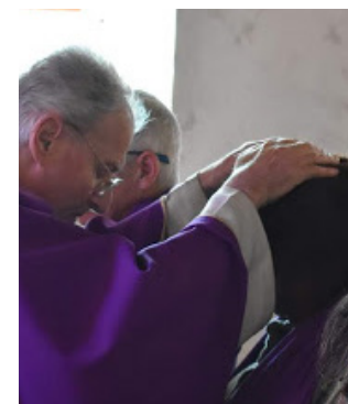
Scrutins: imposition des mains