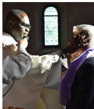
Entrée en catéchuménat: onctions des oreilles, des yeux, de la bouche et du cœur