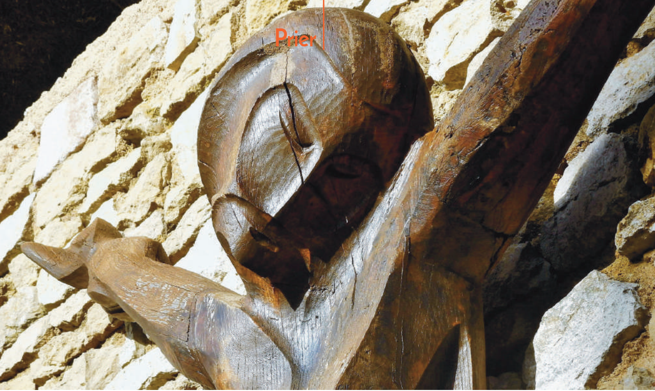
Notre-Dame d'Orient, Sermizelles (89)