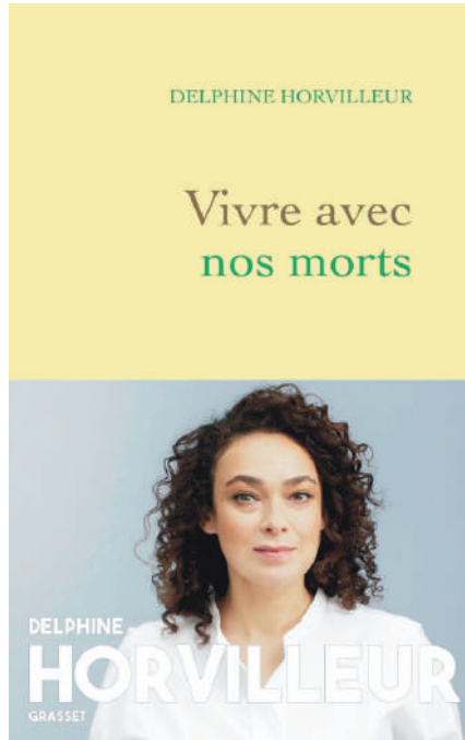
Vivre avec nos morts par Delphine Horvilleur, 234 pages, Grasset 2021.