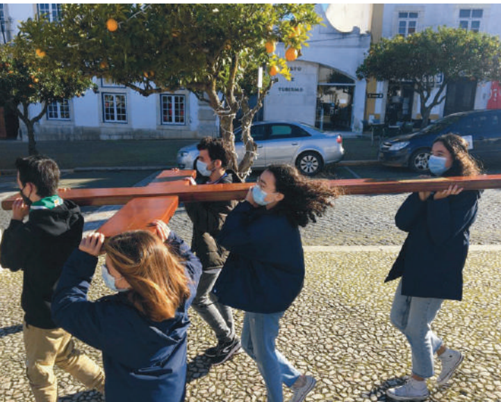
Vila Viçosa, janvier 2022

Depuis novembre 2021, les symboles des JMJ vont en pèlerinage à travers les 21 diocèses du Portugal, annonçant la plus grande rencontre de jeunes du monde qui aura lieu à l'été 2023, à Lisbonne. Ils séjournent un mois dans chaque diocèse. Ces deux symboles sont présents sur les lieux des célébrations, après avoir parcouru le pays hôte pendant le temps de préparation et indiquent le vrai "but" des Journées mondiales de la jeunesse : connaître davantage Jésus dans le Mystère de la Rédemption et confier sa vie à la protection de la Mère de Dieu.